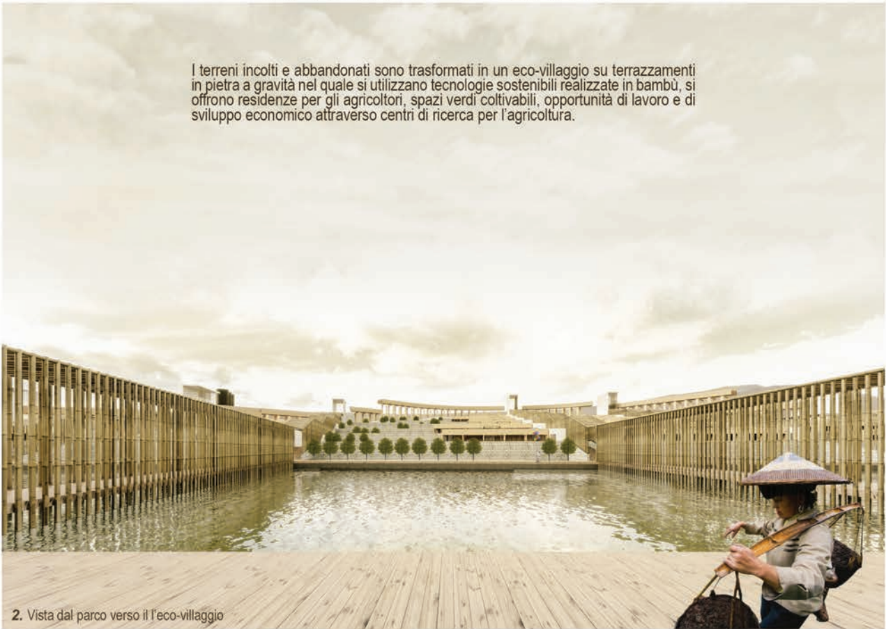
2. Vista dal parco verso il l'eco-villaggio

I terreni incolti e abbandonati sono trasformati in un eco-villaggio su terrazzamenti in pietra a gravità nel quale si utilizzano tecnologie sostenibili realizzate in bambù, si offrono residenze per gli agricoltori, spazi verdi coltivabili, opportunità di lavoro e di sviluppo economico attraverso centri di ricerca per l'agricoltura.