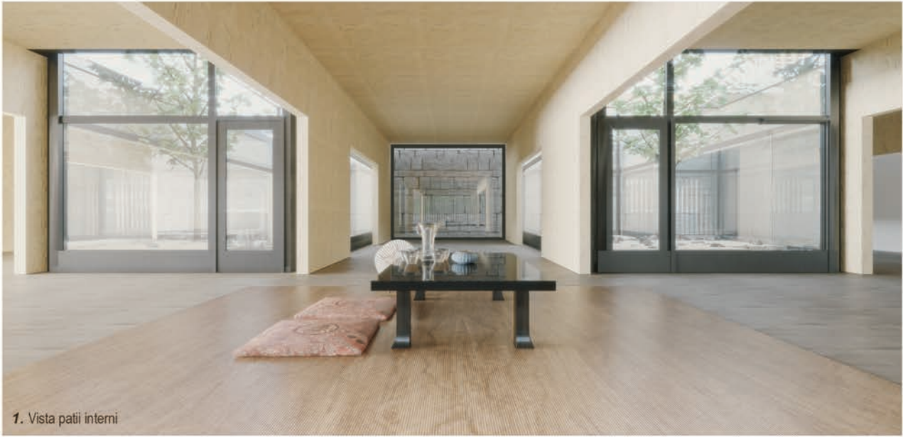
1. Vista patii interni

I terreni incolti e abbandonati sono trasformati in un eco-villaggio su terrazzamenti in pietra a gravità nel quale si utilizzano tecnologie sostenibili realizzate in bambù, si offrono residenze per gli agricoltori, spazi verdi coltivabili, opportunità di lavoro e di sviluppo economico attraverso centri di ricerca per l'agricoltura.